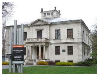
Muzeum Woli, ul. Srebrna 12