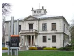
Muzeum Woli, ul. Srebrna 12

Z myślą o akcji „ LATO W MIEŚCIE 2010 ” Muzeum Woli - oddział Muzeum Historycznego m.st. Warszawy przygotowało szereg nowych zajęć, zabaw i warsztatów.